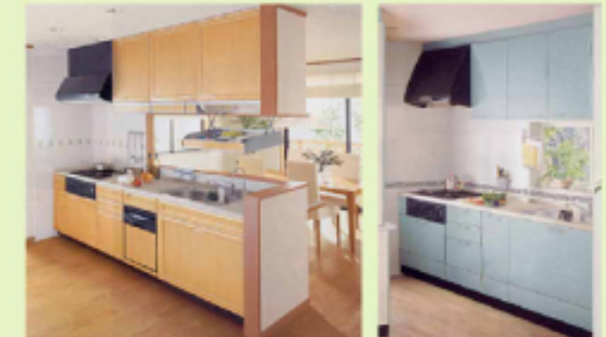
スライドタイプ (写真はシンク下食器洗い乾燥機付) 足元スライドタイプ