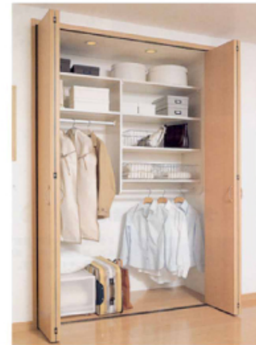
① クローゼット折れ戸 間口1間