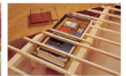
② 床下ユニット収納 2連スライドタイプの本棚 (2階設置用)